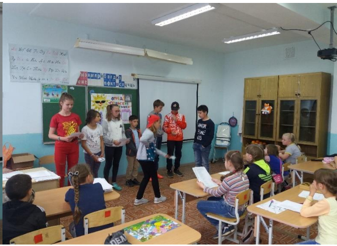
Станция «ПОДАРОК городу к юбилею».