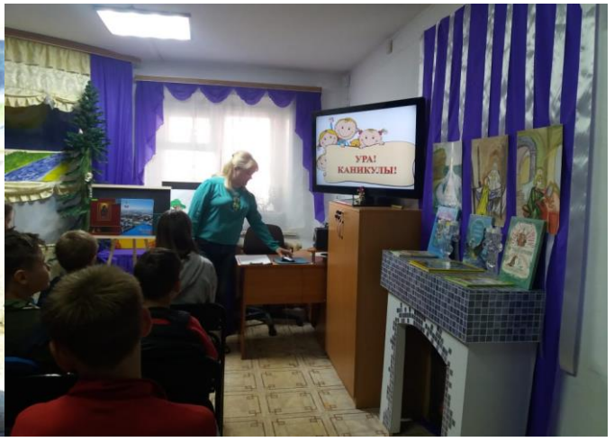
Станция «ДАРЫ сказателей» посещение выставки рисунков на шёлке